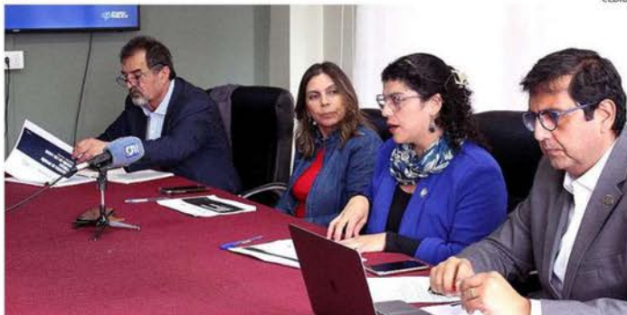
LOS RESULTADOS DE LA ENCUESTA FUERON DADOS A CONOCER AYER. SE APLICÓ EN 27 DE LAS 30 COMUNAS.

La encuesta arroja también que un 57,2% califica de "muy importantes" las propuestas en seguridad pública al momento de elegir a las próximas autoridades y que un 42% está dispuesto a limitar su libertad a cambio de mayor seguridad